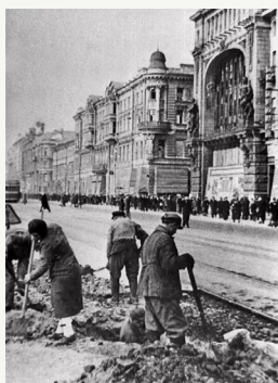
День начала героической обороны Ленинграда

Почти 80 лет назад, 27 января 1944 года, закончился один из самых трагических эпизодов Великой Отечественной войны. Была полностью снята блокада Ленинграда, которая продолжалась 872 дня. Ленинград – единственный в мировой истории город, который смог выдержать почти 900-дневное окружение.