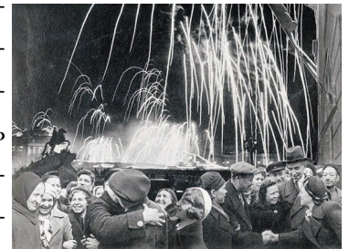
Салют в честь снятия блокады Ленинграда 27 января 1944 года

проложена железная и автомобильная дороги. Январь 1943 г. стал переломным моментом в Ленинградской битве.